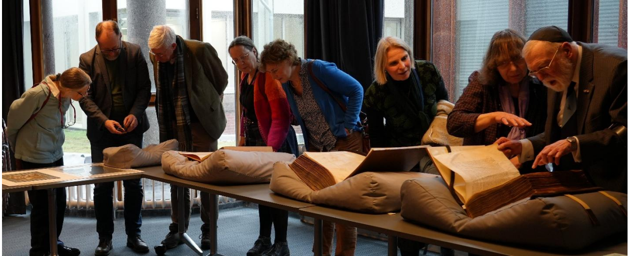
Vlootshow tijdens de Vriendendag