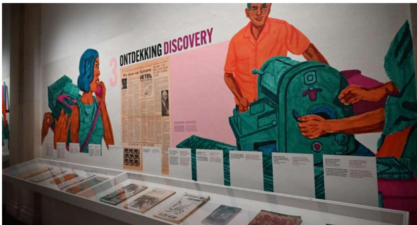
Tentoonstelling 'Strijden ga ik' in Museum De Lakenhal